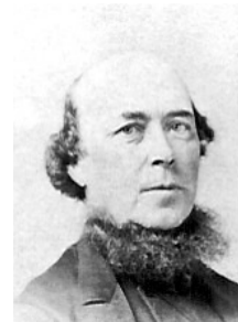
Église-école de Sainte-Anne (Kankakee), Illinois, et le Père Chiniquy